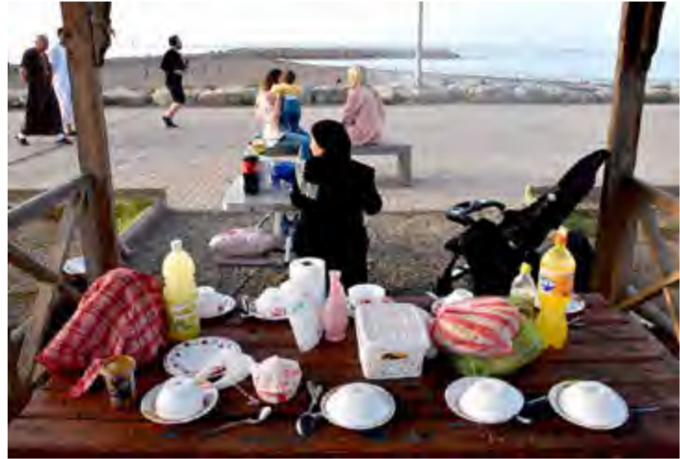
الجزائر: افطار على الشاطئ.