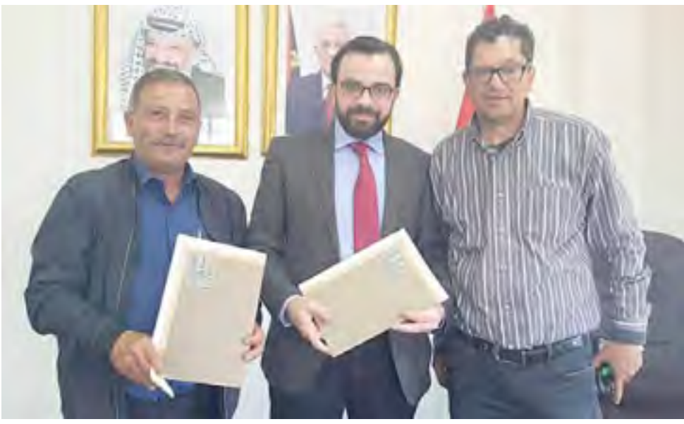
المشاركين في التوقيع.

على تكامل الأدوار ما بين وزارة الثقافة والشركاء من المؤسسات والمراكز الثقافية وهذا العام توقع اتفاق تعاون استراتيجي مع سرية رام الله الأولى باتجاه دعم الفعاليات الثقافية التي تنفذها خدمة للمشاهد الثقافي الفلسطيني، وبشكل أساسي مهرجان رام الله للرقص المعاصر، وهو ما تمثل بتوقيع اتفاقية دعم وتعاون لخمس سنوات.