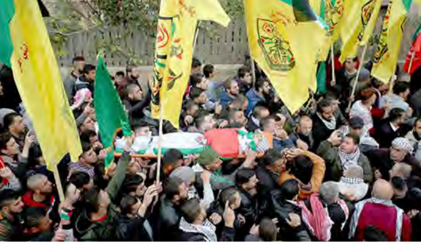
جانب من موكب تشييع الشهيد على قينو فى قرية عراق بورين جنوب غربى نابلس.

حيث أطلق جنود الاحتلال الرصاص الحي وقنابل الغاز المسيل للدموع باتجاه شبان وفتية اقتربوا من السياج الفاصل شرق القطاع.