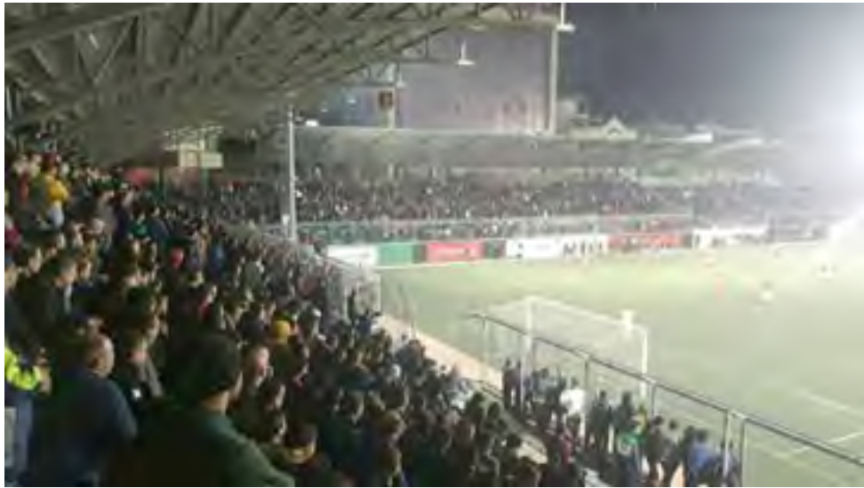
جماهير شباب الخليل حاضرة دوماً في كل المناسبات.

رونقا لكرة القدم الفلسطينية بشكل عام، ولل فريق نفسه بشكل خاص، وما كان يستحقه جمهور كهذا في مرحلة الذهاب، تحقق، فاعتلاء لائحة الترتيب العام، وبعد جهد كبير من الجميع، يعتبر إنجازاً كبيراً يستحق تعظيم الدعم المادي من مؤسسات رجال أعمال المدينة وكل من يجب شباب الخليل.